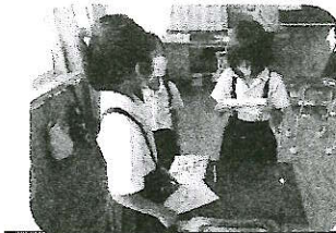
感じたことを交流する児童

猛暑対策もあり、各教室からのリモートで実施しました。今年は、6年生から1学期の長崎修学旅行で学んだことを、