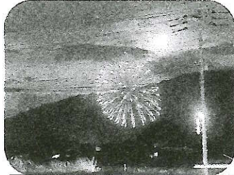
耳納山と月をバックに

前夜の雷雨もすっかり収まり、25日朝、登校してきた子ども達は早速運動場に広がって元気いっぱい遊んでいました。久しぶりに会った友達もいることでした。学校に賑わいが戻ってきました。始業式は集合せずに各教室からのリモートで行いました。始業式の子ども達へのお話で、川会や柴刈方面(筑後川の向こうか手前かはわかりませんが...)で上がった花火の写真を見せました。サプライズ花火に「心配ばかりしては、いいことはやってこない。前を向いて、できることを一步一步やっていかなきゃ何も始まらないんだと、励ましてもらったような気が」したことを伝え「自分や家族、友達など、周りの人たちとのつながりを大切に、一人一人の気づきやアイデアを生かしていきたいと思います。」と話しました。2学期も、子ども達みんなと学び、楽しみ、笑顔いっぱいの柴刈小学校にしていきたいと思ひます。