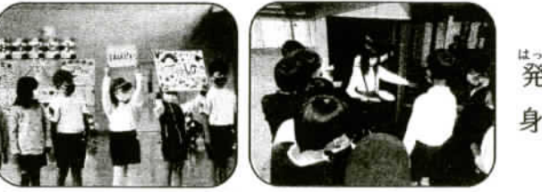
【学校紹介をする2年生】 【飼育方法を習う4年生】

7月20日の終業式で、学校の 重点目標に照らして1学期の子ども 達の学校生活を振り返りました。 「つくる力~活用~」以前学習した 知識や方法を使って問題に取り組みだ り、生活経験で身につけた力を発揮して 取り組んだりしている子ども達。