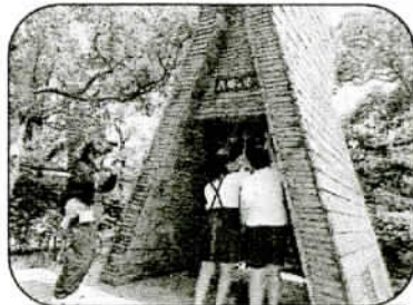
平和の塔に千羽鶴を供えました

2日目は、戦時中に学校ごと移るために、児童生徒と先生達とで手掘りされた「無窮洞」を見学しました。…子ども達が戦争に翻弄されることなく学べる世の中を切に願うばかりです。