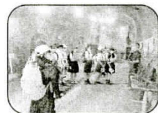
「無窮洞」の中で説明を聞く

城山小学校の『嘉代子桜』のお話はご存じですか。子ども向けの書籍(山本典人:作 新日本出版社)にもなっ