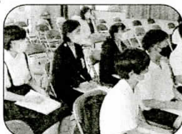
語り部のお話を真剣に聞く6年生